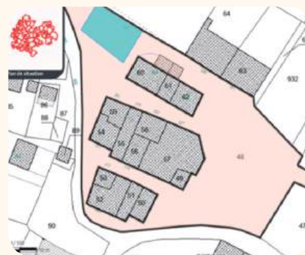
Figure 1 : Parcelle J48

La capacité de la station d'épuration sera de 66 EH sur la base de 23 raccordements. Une optimisation potentielle dans le cadre du raccordement des 10 habitations : la diminution de la capacité avec mise en place éventuelle d'un seul filtre à la place de deux pour 66 EH est envisagée. Elle permettra l'assainissement des habitations dépourvues de terrains à proximité. De plus, ce scénario permettra de réduire de près de 50% le montant des travaux.